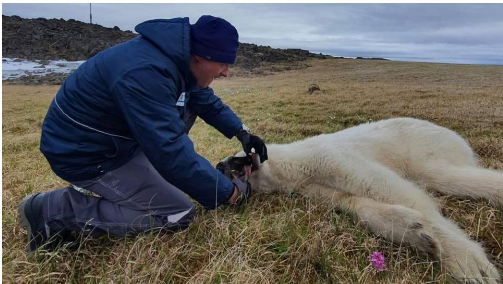
Специалисты осматривают белого медведя в посёлке Диксон

Самый северный посёлок на Енисее – порт Диксон – это самый северный населённый пункт нашей страны. Именно там осенью 2022 года спасли белого медведя и отправили на реабилитацию в Московский ЗООПАРК.