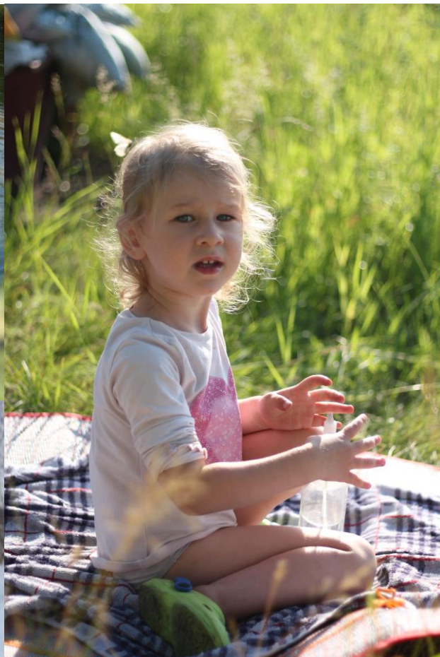
На берегу Енисея. Летние и зимние пикники.