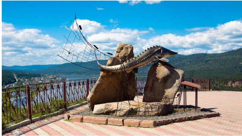
Памятник Царь-рыбе на Смотровой площадке на р. Енисей

В 2004 году установлен памятник так называемой «Царь-рыбе» - осетру. Его можно назвать символом Красноярского края.