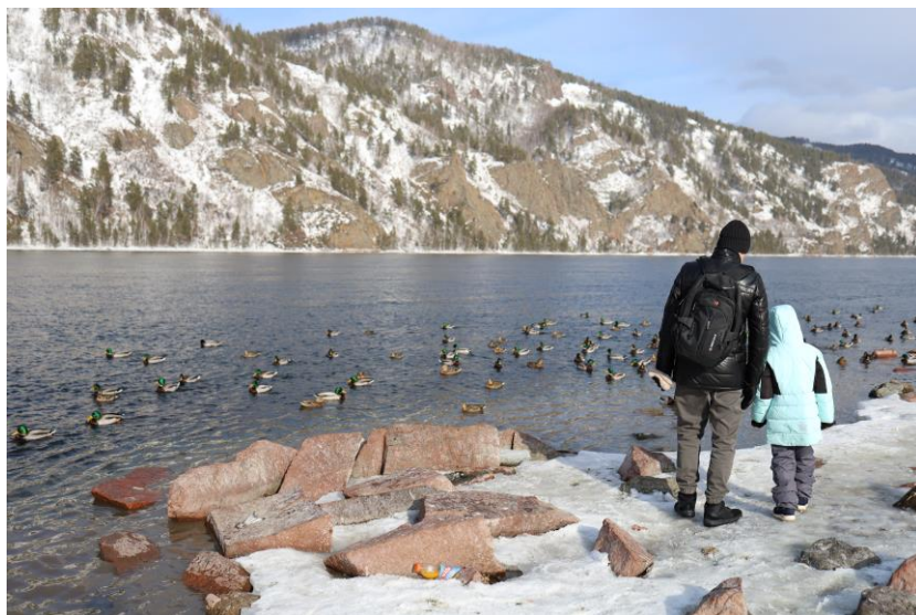
Набережная г. Дивногорска

Дивногорск окружен живописными горами. Здесь чисто, уютно, немало достопримечательностей. Функционирует Красноярская ГЭС (Гидроэлектростанция), на которой работают много дивногорцев.