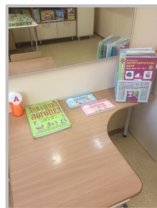
График работы учителя-логопеда